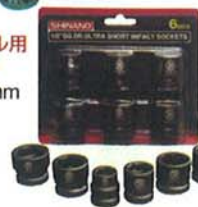
ショートソケット 13・17・19・21・22・24mm 全長：28mm