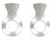
スーパーピラー カットブレード