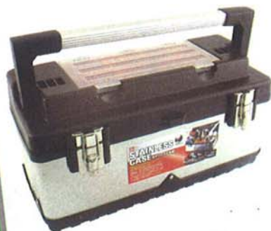
ステンレス工具箱