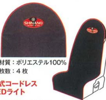
自動車整備作業用 シナノオリジナルシートカバー

ニッケル水素電池 DC 3.6V 充電時間：3時間 使用時間：4時間 全長：138mm