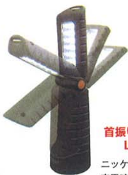
首振り式コードレス LEDライト