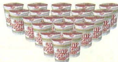
カップヌードル1ケース (20食入り)