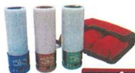
アルミホイール用 ロングソケット 17・19・21mm